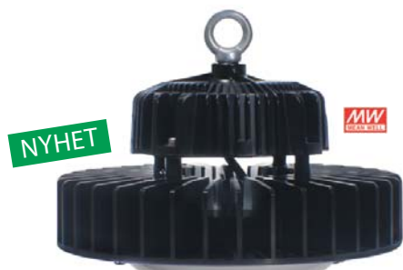
High Bay Compact 200W