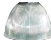
70° polykarbonat reflektor 711701 33 040 05 / 711702 33 040 06