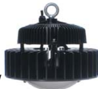
High Bay Compact 150W