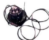
715118 33 040 08 Forl.ledn.1,5m 230V 715119 33 040 09 Forl.ledn. 1,5m 1-10V